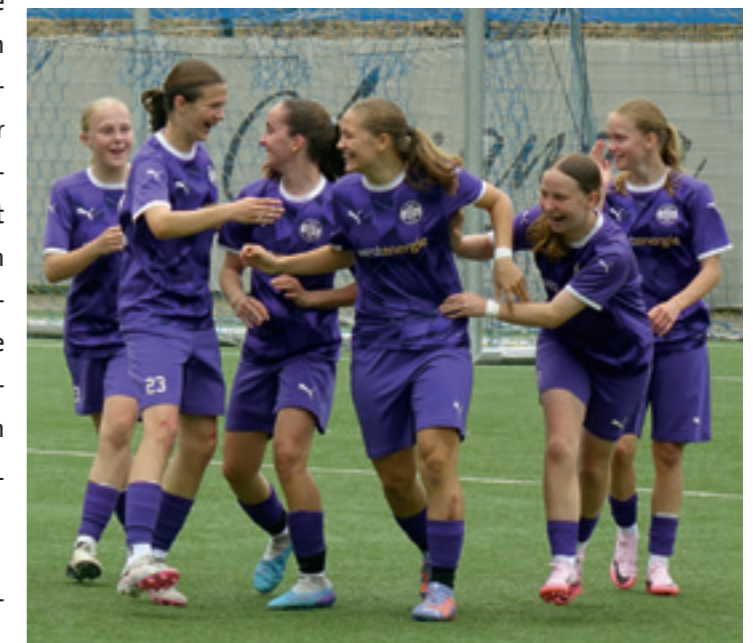
Das 1:0 ließ hoffen