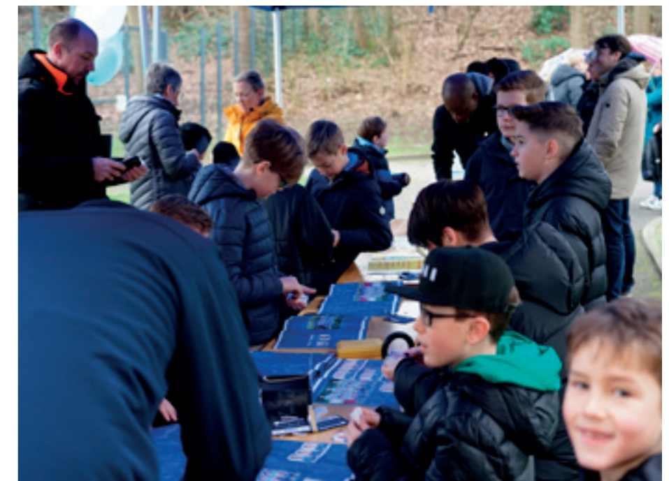
Das Sammelfieber packte Klein und Groß.