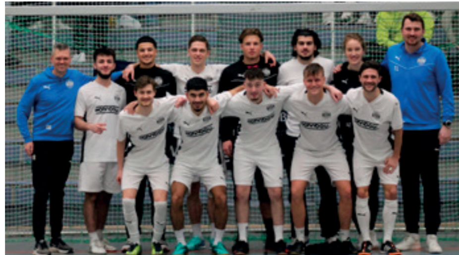
Die Erste freut sich über den dritten Platz bei den diesjährigen Essener Stadtmeisterschaften im Hallenfußball.

Und die begann mit einem für Hallenfußball eher ungewöhnlichen 0:0 im ersten Spiel gegen den Landesligagefährten SpVgg Steele. Keiner wollte einen Fehler machen und sich die Möglichkeiten auf die Finalrunde „versauen“. Und es lief alles für die SGS. Steele konnte im zweiten Spiel seinen zwischenzeitlichen Vorsprung von 4:1 gegen TuS Helene nicht halten; die Partie endete 4:3. Gleichzeitig trennten sich die Schönebecker von TGD Essen-West 2:2. Die letzten