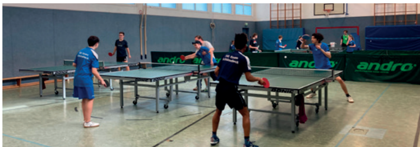
Training für die Meisterschaft: Mittwochs und freitags platzt die Sporthalle an der Eichendorffschule immer aus allen Nähten