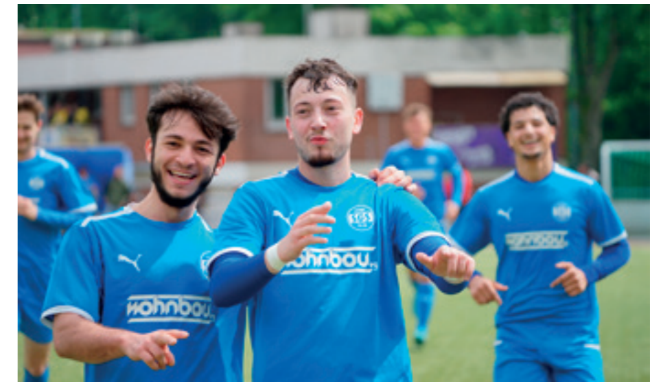
Ja, Klassenerhalt geschafft! Die Erste hatte allen Grund zur Freude.