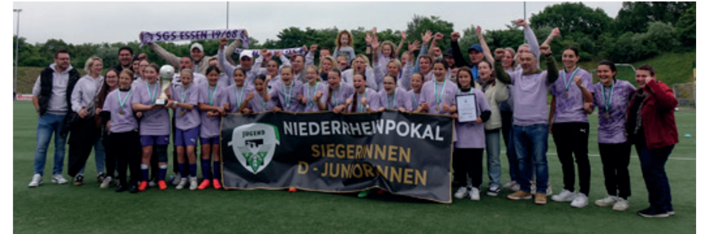
U13 Niederrheinpokalsieger 2024

Damit wiederholte der U13 Nachwuchs aus der Ruhrstadt seinen letztjährigen Erfolg und der Pokal kommt wieder an die Schönebecker Ardelhütte.