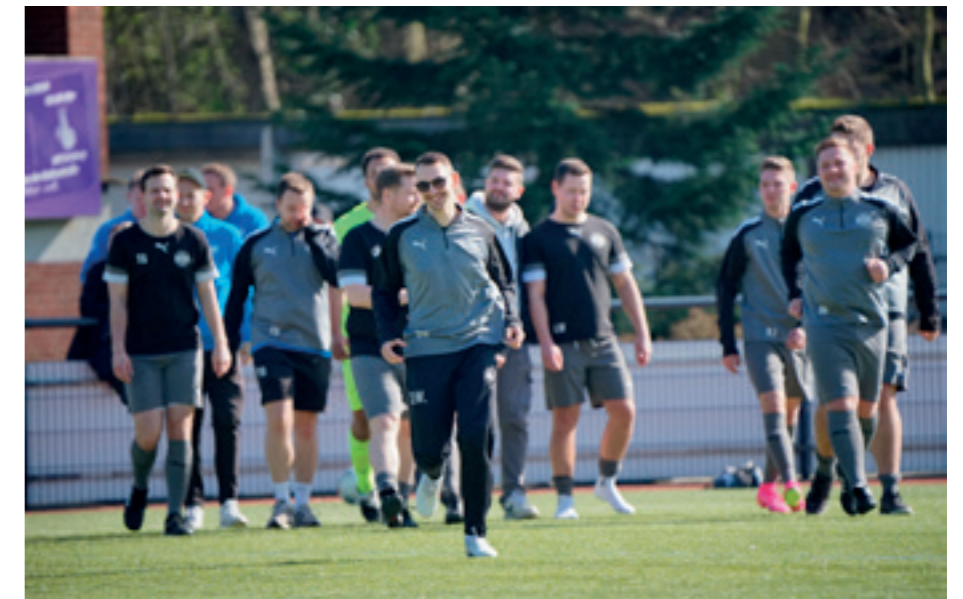
Die Freude bei der Vierten ist berechtigt. Das Team spielte eine herausragende Saison in der Kreisliga B, Gruppe 2.